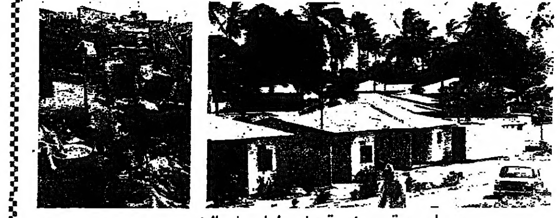
مدن افريقية نموذجية قبل حلول عام الفين

في ٢٢ من الملة من سكان افريقيا واسيا وامريكا اللاتينية سوف يصحون في العام ١٩٨٠ من سكان الذين التي يزيد عدد سكانها عن ٢٠ الف نسمة . وسوف ترتفع هذه النسبة في عام الفين الى ٢١ في الملة . اي ان ضمتها كانت عليه في العام ١٩٦٠ . ويرود في تقرير للأمم المتحدة بهذا الخصوص ، بأنه سوف يسكن ٢٠ مليون نسمة من مجموع ٧٠٠ مليون نسمة من سكان مدن الملة ، في مدن يزيد عدد سكانها عن نصف مليون نسمة . وكان هذا العدد في ١٢ من العام ١٩٦٠ عن ١٢ مليون فقط . وروضة يتله يرتفع سكان المدن الافريقية ، مثل كينيا وكولمبيا ودار السلام مثلا ، في الملة . ويقع اليوم نصف سكان ١٠٠ مليون في مجموعة من المدن افريقية التي يزيد مجموع سكانها عن ٢٠ مليون نسمة في افريقيا واسيا وامريكا اللاتينية . كبيراً تصور عظام الجسم توصل الطب في تصوير العظام في الجسم على ابعادها الثلاثة ، اي من جميع اطرافها دون الحاجة الى اجراء جراحة للبرقي ، او تعريضه للتسعة السنية الخطرة عند التقاط صور العظام . وتحتاج هذه الطريقة ، التي تميل كيميائياً لتسليط اشعة اكس ام على العظام ، وتلتقط الصور العظام داخل الجسم من جميع اطرافها . وينظر ان تظهر الكالسيوم في العظام ، وتعمل هذه الاشعة بطولها في العظام ، وبواسطة انبوب طويل الى الملقح . اما الوقت الذي يستغرقه تخليص جرح جراحتها يتراوح بين ٤٠ و ٦٠ دقيقة . مادة معقمة طويلة المفعول مادة كيميائية معقمة تستخدم في المدارس وحدائق الاطفال في هاينجورج ، تم اكتشافها مؤخراً . وهذه المادة تقوى على المواد المعقمة الاخرى بطول مفعولها الذي يمتد الى اربعة اسابيع ، في حين يمتد مفعول المادة الاخرى لا يتعدى الثلاثة او الاربعة ايام .